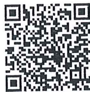
ใบสมัครและเอกสารโครงการ

วิทยาลัยการจัดการอุตสาหกรรมบริการ โทร ๐๙๙ ๐๕๑ ๓๓๔๔, ๐๙๙ ๐๙๗ ๔๔๘๘ E-mail : ssru.coaching@gmail.com