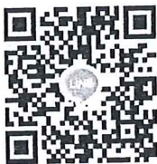
กลุ่มหลักสูตร Actice Teacher

คณบดีวิทยาลัยการจัดการอุตสาหกรรมบริการ ปฏิบัติราชการแทนอธิการบดีมหาวิทยาลัยราชภัฏสวนสุนันทา